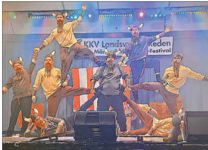
Das Männerballett der Ki-Ka-Ju beim Turnier in Landsweiler

Nun geht es in die kreative Pause bis im Sommer das Training für die Session 2025/26 beginnt. Dazu sind neue Mit tänzer herzlich willkommen. Infos unter: www.kikaju.de Kontakt: michael@kikaju.de