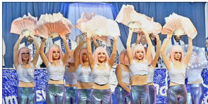
Die Meerjungfrauen unserer Juniorengarde