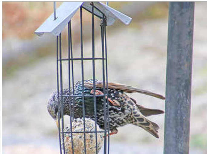
Star am Meisenknödel