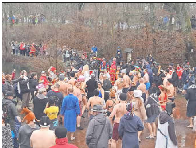
Anspannung und Vorfreude vor dem Start: Gleich geht's los ...