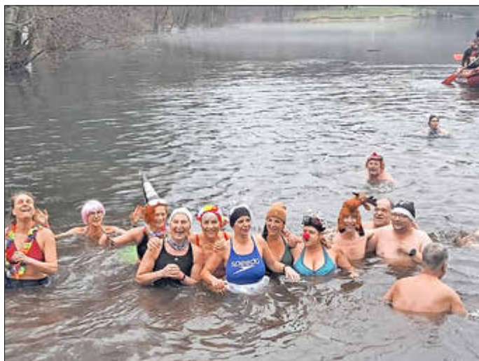
Wohlfühlen im 2 Grad kalten Wasser? Ja das geht - zumindest kurz

„Eisschwimmen ist nix für Warmduscher“ so der Wahlspruch der Merchweiler Seelöwen zum Neujahrsschwimmen 2025, das durch Glatteis, Starkregen und Sturm bedroht war. Das Glatteis wurde vom Regen größtenteils weggetaut und der Wind hielt sich in Grenzen, damit konnte das 17. offizielle Neujahrsschwimmen der Merchweiler Seelöwen starten. Dabei war es eigentlich das „kleine Jubiläum“, denn vor zwanzig Jahren, 2005 stiegen die ersten Seelöwen, damals noch „inoffiziell“ erstmals zum neuen Jahr in den Itzenplitzer Weiher. Niemand ahnte damals, was sich daraus entwickeln würde.