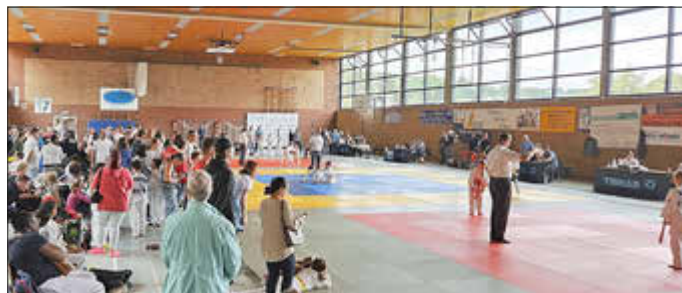
Blick in die Halle während der U11-Wettkämpfe.

Das Turnier ehrt Ruprecht Drouet, Gründer des Judo-Clubs Wemmetsweiler e.V. im Jahr 1950. Der JCW gehört zu den ältesten Judo-Vereinen des Saarlandes.