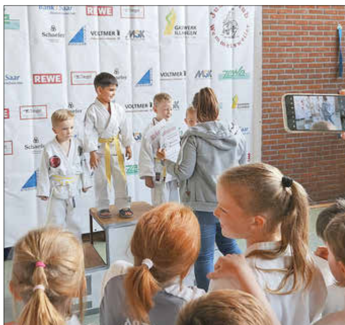
Siegerehrung in der Altersklasse U 11.