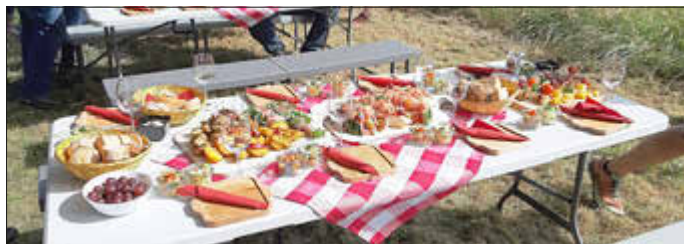
Leckerer Abschluss des Konzertausflugs

schließender Verköstigung. Zunächst gings mit der Seilbahn von Saarburg hinauf zum Warsberg. Es schloss sich eine geführte Wanderung rund um den Warsberg an. Idyllisch mitten in der freien Natur mit Blick auf Ayl und die Weinberge gab es dann zum Abschluss eine opulente Vesper mit einigen Weinen der Region.