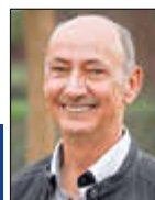
Mitteilungen des Ortsvorstehers OT Wemmetsweiler