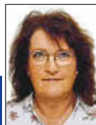
Mitteilungen der Ortsvorsteherin OT Merchweiler