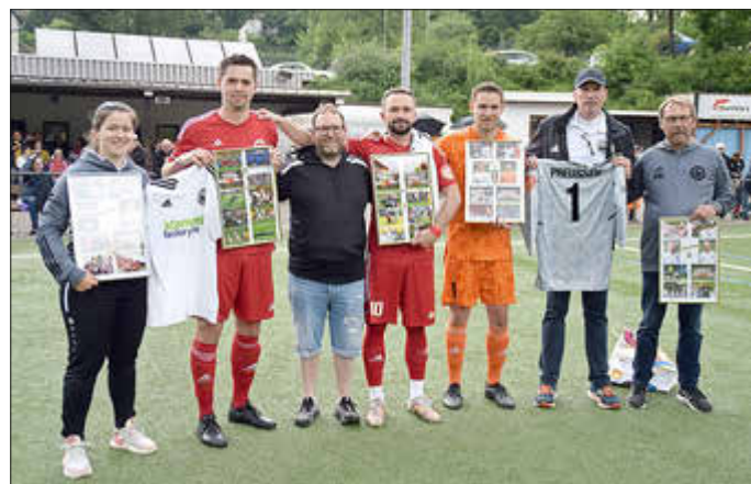
Fotocollagen und Trikots erinnern an tolle Momente